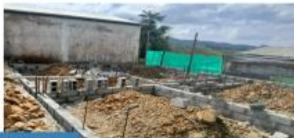
Alto de Mulatos